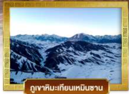
ภูเขาหิมะเทียนเหินซาน