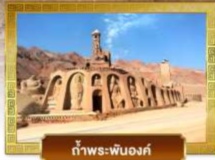
ก้ำพระปันองค์