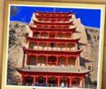
ต้าเถะสลักม่อเกา