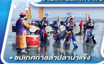
ชมเทศกาลสาปน้ำแข็ง