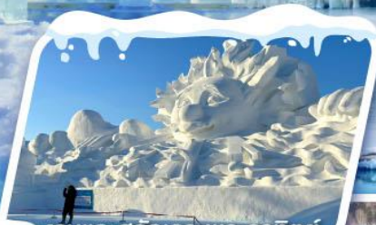
งานแกะสลักเกาะพระอาทิตย์