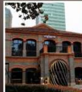
ย่านเฟิงเซินหลี่

รับฟรี!! ประกันสุขภาพ และ อุบัติเหตุ 2 ล้านบาท