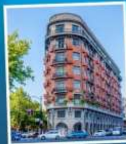
ถนนอู่คัง