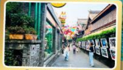
ถนนโบราณชอยกวางชอยแคบ