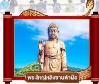
พระใหญ่หิงซานคำน้อ