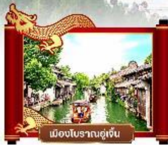
เมืองโบราณอู๋เซิน