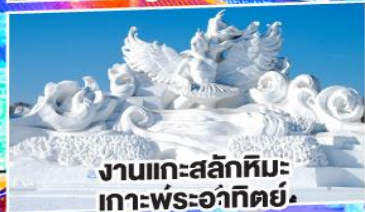
งานแกะสลักหิมะ เกาะพระอาทิตย์