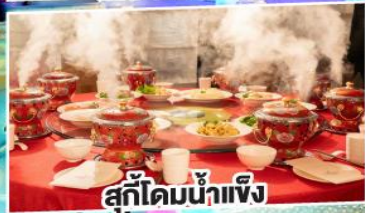
สุกี้ไต้มน้ำแข็ง