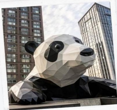
ถนนชุนซีลู่