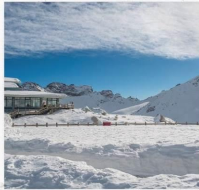
ภูเขาหิมะการ์เซียต้ากู่ปิงชว่น