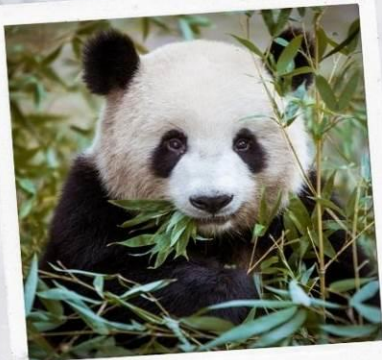
ศูนย์อนุรักษ์หมีแพนด้า