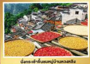
หมู่บ้านชานชานหมู่บ้านหวงหลิง