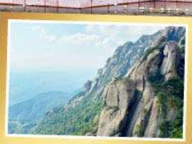
เขาหลิงซาน