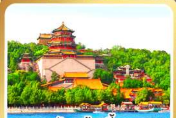
พระราชวังฤดูร้อนอี้เหอหยวน