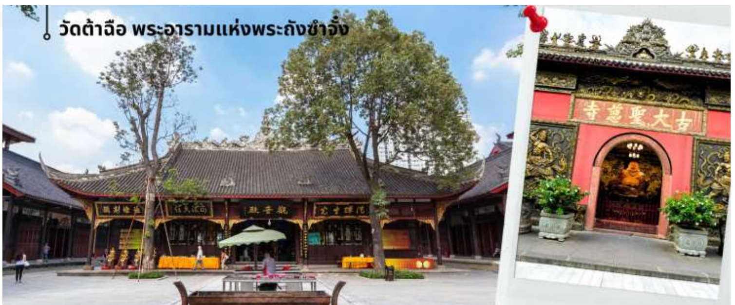
วัดต้าฉือ พระอารามแห่งพระถังซำจั๋ง

นำท่านชม วัดต้าฉือ (พระอารามแห่งพระถังซำจั๋ง) ในกลางนครเฉิงตู พระถังซำจั๋ง ได้รับการสรรเสริญว่าเป็นผู้มีความเพียร และมีชื่อเสียงมายาวนานกว่า 1,400 ปี และยังได้รับการยกย่องว่าเป็น พระไตรปิฎกแห่งราชวงศ์ถัง พุทธประวัติของพระถังซำจั๋งถูกจารึกในสถานที่ต่างๆ มากมาย รวมไปถึงได้ถูกกล่าวถึงในจดหมายเหตุหลายเล่ม ตามเส้นทางการเดินทางแห่งความเพียรของท่าน รวมทั้งมีพระอัฐิของท่าน ประดิษฐานอยู่ในพระอารามของนครนานจิง และที่ทะเลสาบสุรียันจันทราเป็นเกาะได้วันอีกด้วย