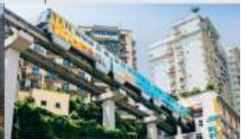
รถไฟฟ้าทะเลตึก

*ทางบริษัทฯ ขอสงวนสิทธิ์ในการสลับโปรแกรมทัวร์ตามความเหมาะสมขึ้นอยู่กับสถานการณ์ปัจจุบัน โดยคำนึงถึงผลประโยชน์ของลูกค้าเป็นสำคัญ