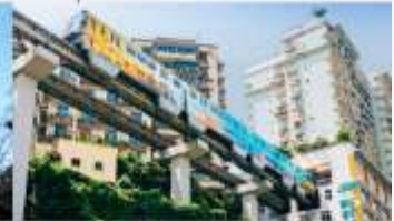
รถไฟฟ้าทะเลอู๋ตึก

*ทางบริษัทฯ ขอสงวนสิทธิ์ในการปรับเปลี่ยนโปรแกรมทัวร์ตามความเหมาะสมขึ้นอยู่กับสถานการณ์ปัจจุบัน โดยคำนึงถึงผลประโยชน์ของลูกค้าเป็นสำคัญ