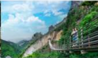
หุบเขารอยแยกอุ๋หลิงซาน