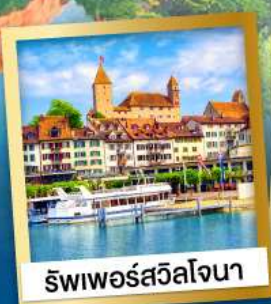
รัฟเฟอร์สวิลเจนา