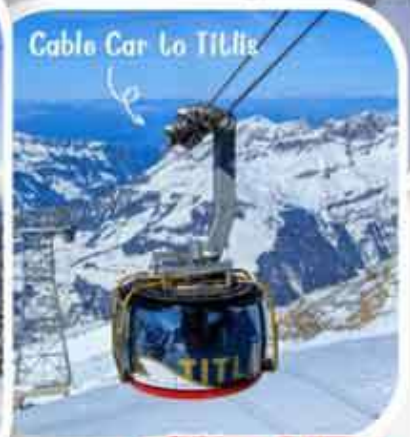
Cable Car Lo Tittel