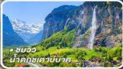
• ชมวิว น้ำตกเซาบาค

กับรถไฟด่วนขบวนสวรรค์ เซอร์แมท-อันเดอร์แมท