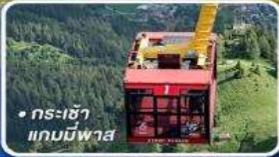
• กระเช้า แกมมีพาส