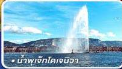
• น้ำพุเจ็กโคเจนิวา

นั่งรถไฟด่วนกราสเซียมูร์สระดับเฟิร์สคลาส ขึ้น 4 เหน่าดังแห่งสวิส อาบน้ำแร่พักในเมืองลูเกอร์บาด