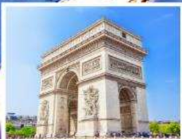
ประศูชัยปารีส