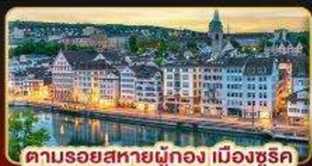
ตามรอยสหายผู้กอง เมืองซูริค