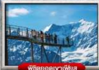
พิชิตยอดเขาเฟียส