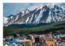
เมืองเอลคาลาฟาเต

** พักที่ Xelena Hotel 4* หรือเทียบเท่า **