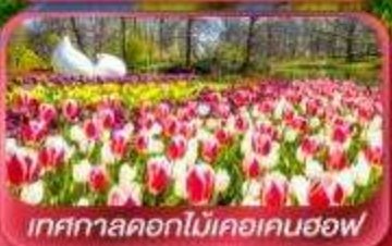
เทศกาลดอกไม้เคอเคนฮอฟ