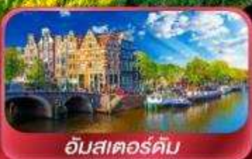
อัมสเตอร์ดัม