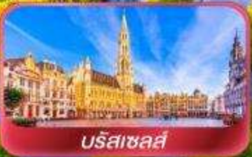
บรัสเซลส์

ไปดูกังหันลมหมุนวนที่หมู่บ้านซานสคินส์กับ