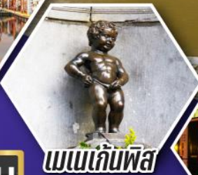
แมนเกินฟิส