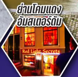
ย่านโคมแดง อัมสเตอร์ดัม

ตะลุยอัมสเตอร์ดัม ทั้งจตุรัสตามสแควร์ และย่านโคมแดง (Red Light)