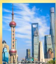
เชียงใหม่