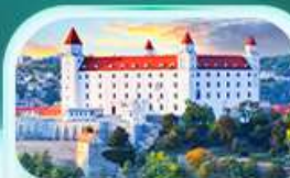
ปราสาทปราติสลาวา

เที่ยวชมเมืองฮัลล์สตัดท์ หมู่บ้านริบะทะเลสาบสวยที่สุดในโลก พระราชวังเซินบรุนน์ เมืองลินซ์ จิตรกรรมฝาผนังยักษ์ สัมผัสเมืองมรดกโลก เซสกี ครอบล้อฟ เยี่ยมชมปราสาทปราก ถนนทองคำ เชิดอันสถานที่ชื่อดัง! ปราสาทปราติสลาวา ส่องเรือชมความงามแม่น้ำดานูบ แม่น้ำที่ยาวที่สุดในยุโรป ชมความน่าหลงใหลของ ปราสาทบูคาเปสต์ สะพานชาร์ลส์