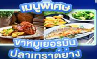
เมนูพิเศษ ชาหมูเยอรมัน ปลาเกรดย่าง

เวียนนา ปราสาทนอยชวาสไตน์ ลูเซิร์น เซอร์แมท ชุก ซูริก