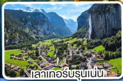
เลาเคอร์บรุนเนน