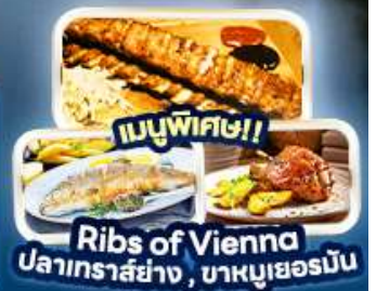
เมนูพิเศษ!! Ribs of Vienna ปลาเทราสย่าง, บาหมูเยอร์มัน