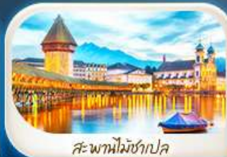
สะพานไมซ์ฮาเปล