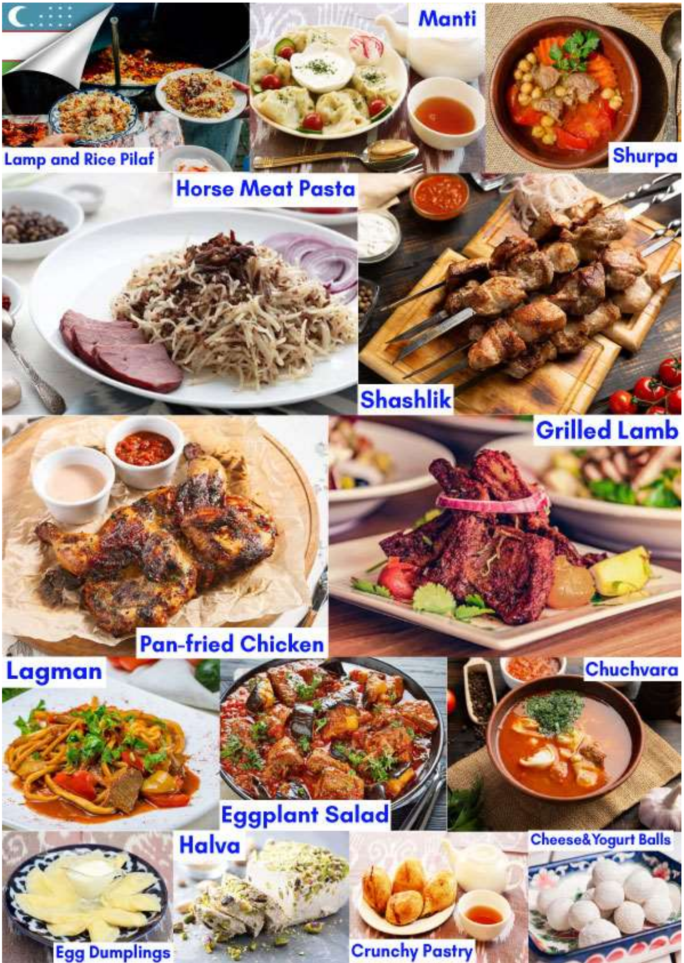
Lamp and Rice Pilaf